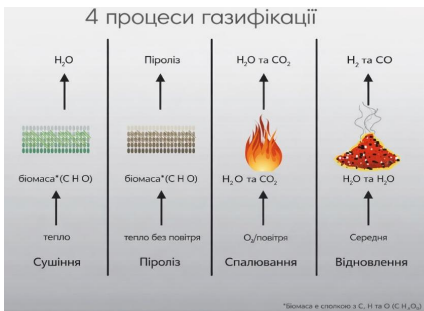
Рисунок 2 – Концентрації забруднюючих речовин за різних часток від граничних значень викидів (ELV)

дозволяє інтегрувати процес у єдину енергетичну схему з централізованим контролем викидів. Порівняно зі спалюванням, газифікаційні установки характеризуються меншою кількістю димових газів на одиницю обробленої маси відходів, що спрощує досягнення нормативних вимог. Порівняльні характеристики основних термохімічних технологій перероблення відходів наведено в табл. 4.